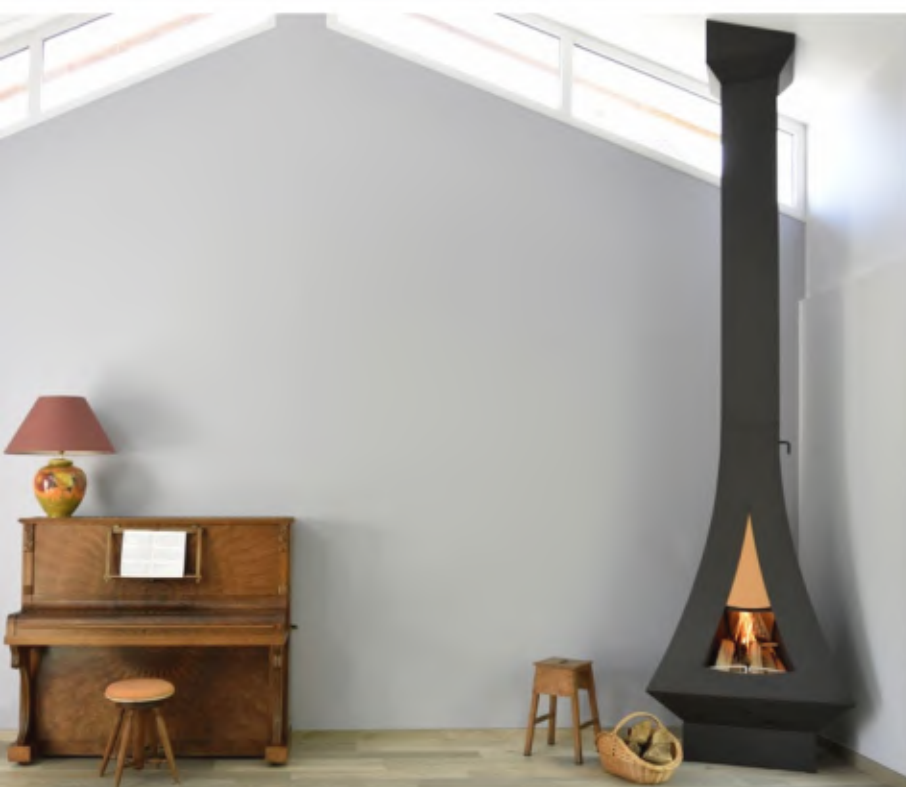
OUVERTURE LATÉRALE POUR SIMPLIFIER LE NETTOYAGE