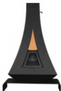
SUR SOCLE COURBÉ